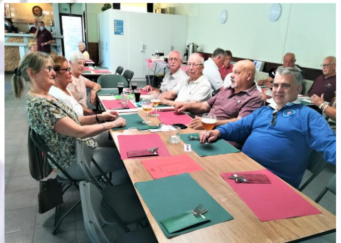
en ze moeten er nog aan beginnen