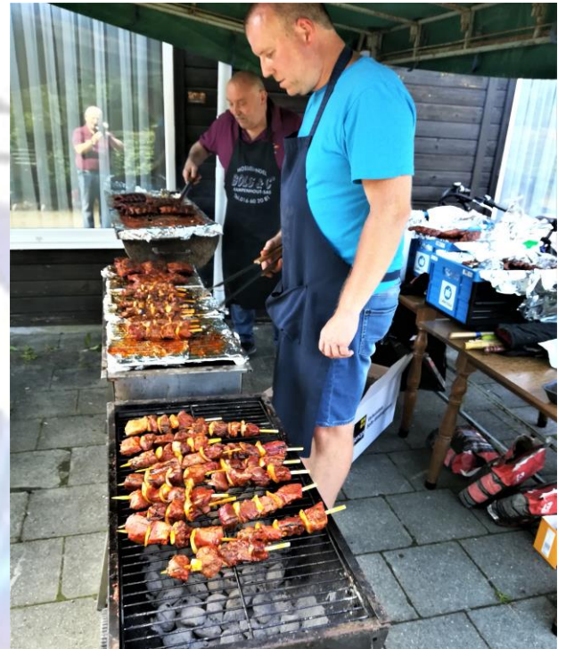
Pa en zoon in hun element