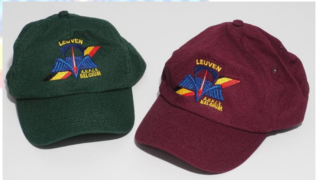
Petje rood of Groen 15 euro