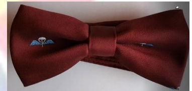
Strikje in UK op bestelling(*)