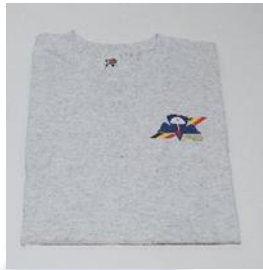
T-shirt 15 euro grijs