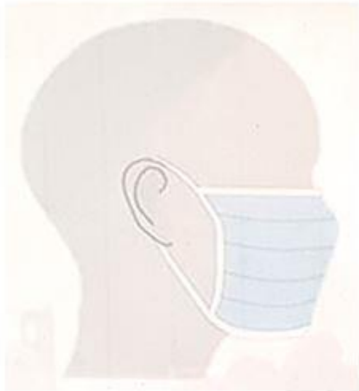
Gelooft in de wetenschap