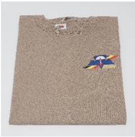
T-shirt 15 euro Dessert kleur