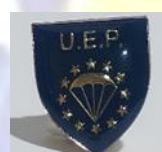
Pin 4 euro