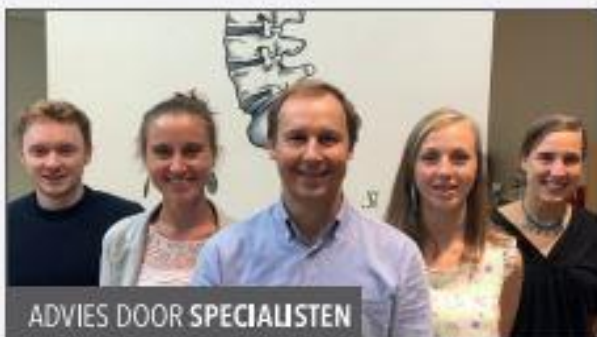
ADVIES DOOR SPECIALISTEN