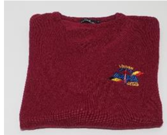
Pull of polo op bestelling

Alle artikelen te verkrijgen in burgundy en bottle green