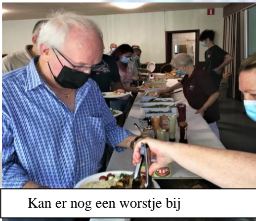
Kan er nog een worstje bij

Woorje van onze penningmester Beste leden en familie Na een lange tijd van Non- Actief Hebben we zaterdag 14 augustus een FANTASTISCHE BBQ gehad. Het weer zat ons geweldig mee ,heel veel volk, en een goede sfeer. Dank vooral aan alle medewerkers, en werksters voor jullie FANTASTISCHE INZET. Ook de 5 leden van de Chiro van Pellenberg, die ons bijgestaan hebben. DIKKE DANKJEWEL. Het was een onverhoopt succes en hopelijk een vervolg op ons Mosselstijn. Vele Paracdo grtj. Dompi