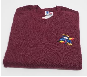
Sweater op bestelling