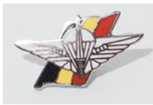
Pin 4 euro