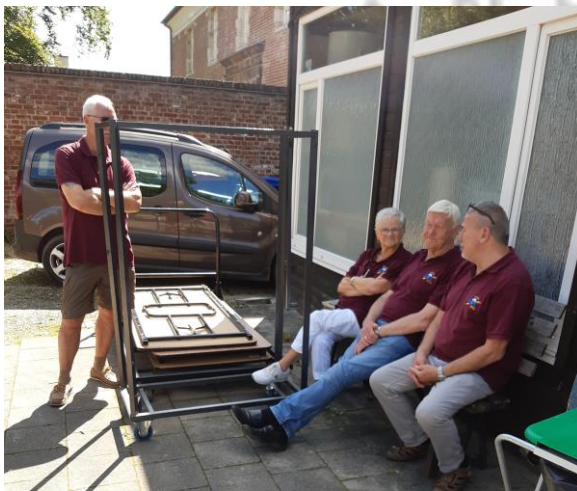
Kalmte voor de storm

Met de steun van de CHIRO van Penneberg verliep de bediening van drank, koffie en taarten en opruiming vlotjes. Dank aan al de leden en sympathisanten van dienst.