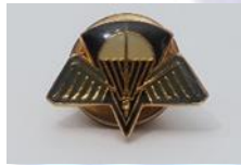
Pin 4 euro