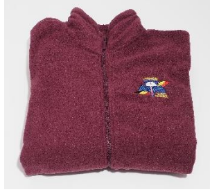
fleece op bestelling