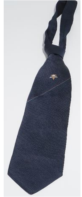
Das op bestelling 15 Euro

Alle artikelen te verkrijgen in burgundy en bottle green