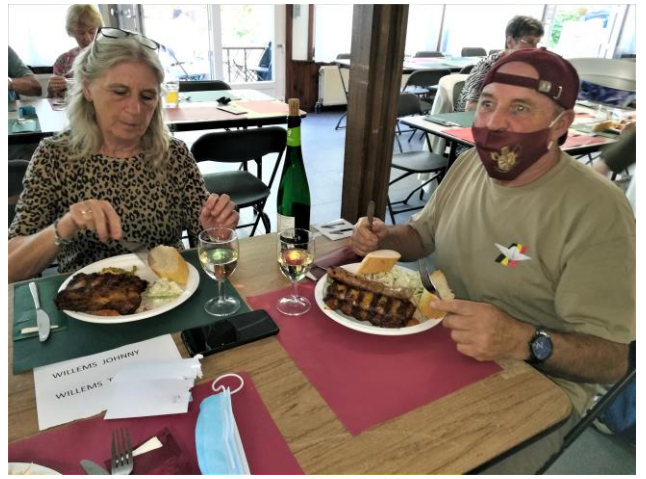
moelijk gaat ook