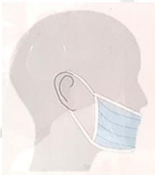
Begrijp de wetenschap niet