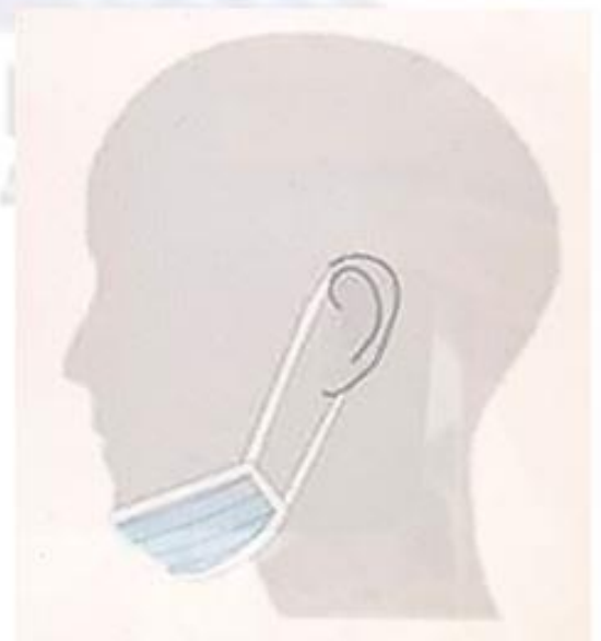
Gelooft in Magie