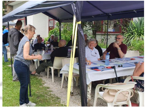
Schoon volk trekt mooi volk aan