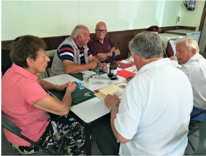
Het 16 de Détachement