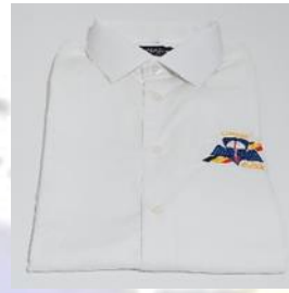
Wit hemd LM of KM op bestelling