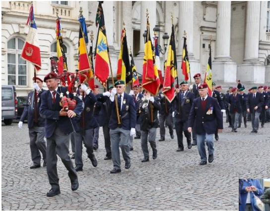
Na de eredienst, in défilé naar de Onbekende Soldaat of Congres kolom.