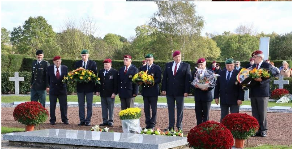
De Regionalen Mouscron, Leuven en Brabant