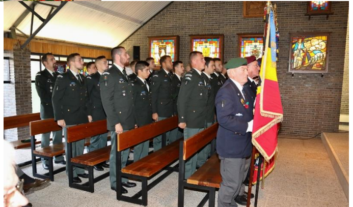
De 13Cie ParaCdo uit Flawinne. Toen rode muts nu groene muts

Na de eredienst werd de verplaatsing naar de begraafplaats gemaakt.