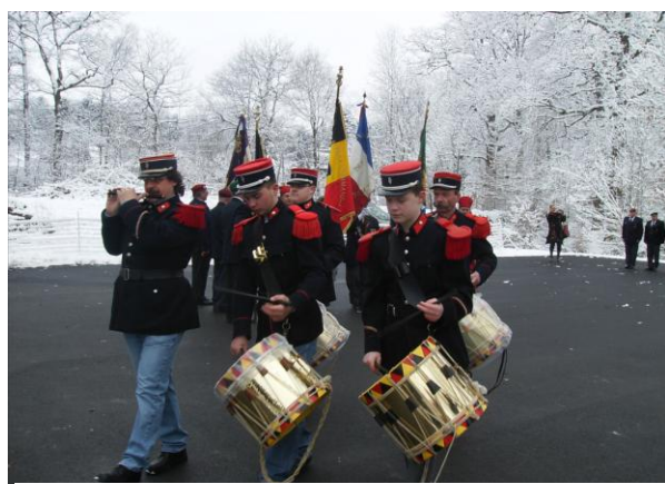
Aftreden van de drie vaandels, Lille, Thudinie en Menen onder begeleiding van het Zouaven eredetachement.

De plechtigheid startte, ondanks de bittere kou buiten.