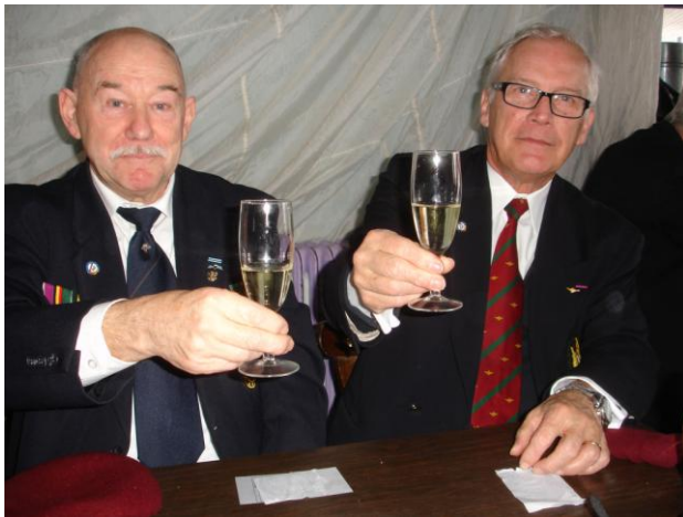
Klas 1959 en ze kunnen het nog en klagen is voor later

Deze verbroedering toonde nogmaals aan dat de 'Spirit' onder de Paracommando's geen grenzen kent. Zowel onze taalgrens als onze staatsgrens kan de solidariteit tussen de verschillende parachutisten- en commando-eenheden niet stoppen.