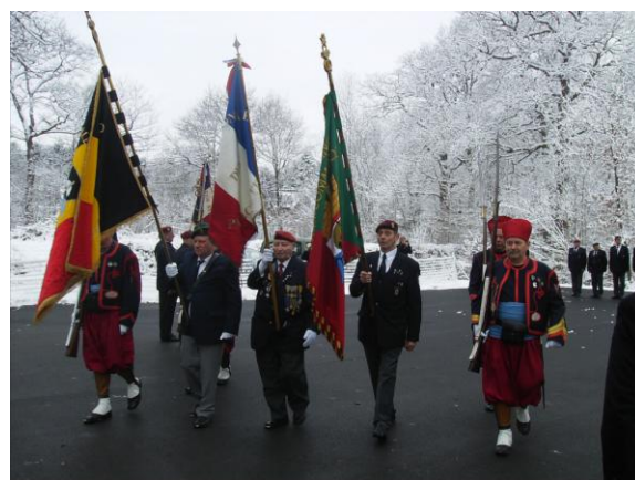
De vaandels van Lille, Menen en Thudinie met het Zouaven eredetachement