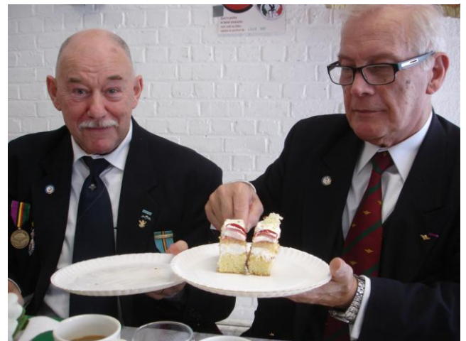
Eerlijk delen, deze avond nemen we toch een Glucophaagje (die zijn toch gratis)