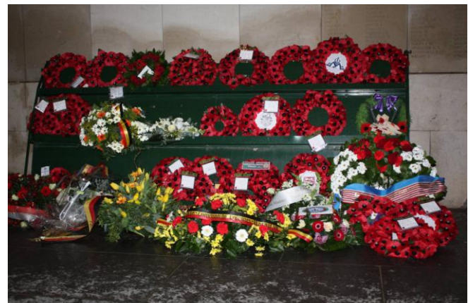
Het groot aantal bloemstukken en kronen bewijzen het groot aantal deelnemers