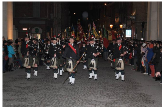
De Ipres Surrey Pipes & Drums

Aankomst van de vaandels en in plaats stelling. Uiterst recht het vaandel van de PRA Ilford 84 Branch