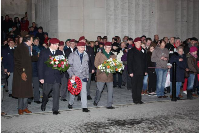
ANPCV Oostende, Mouscron en Leuven

Deze “Last Post” kon zoals bijna elke dag rekenen op de aanwezigheid van talrijke Britse jongeren die sereen deelname aan deze toch wel indrukwekkende plechtigheid