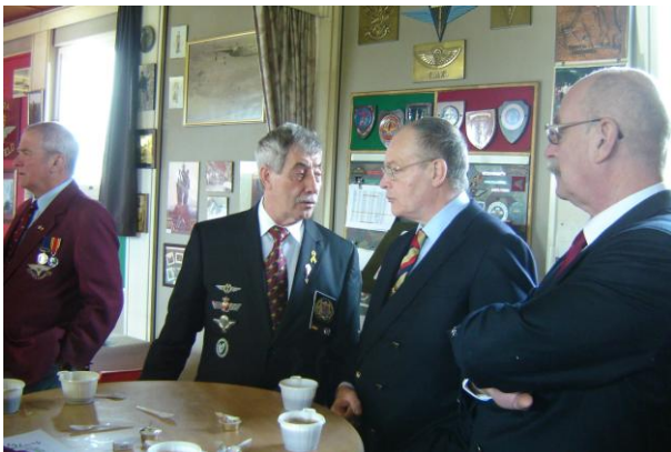
Aankomst van de deelnemers.

Les WEST Activity Coordinator Ilford 84 Branch