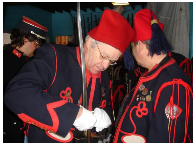
G.d.v.d.... (vertaling op de redactie) mijn cartouche is te lang. Gaat met zo een soldaat naar de oorlog