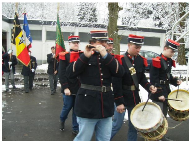
Onder de begeleiding van het Zouaven detachement treden de vaandels van Lille, Menen en Thudinie aan