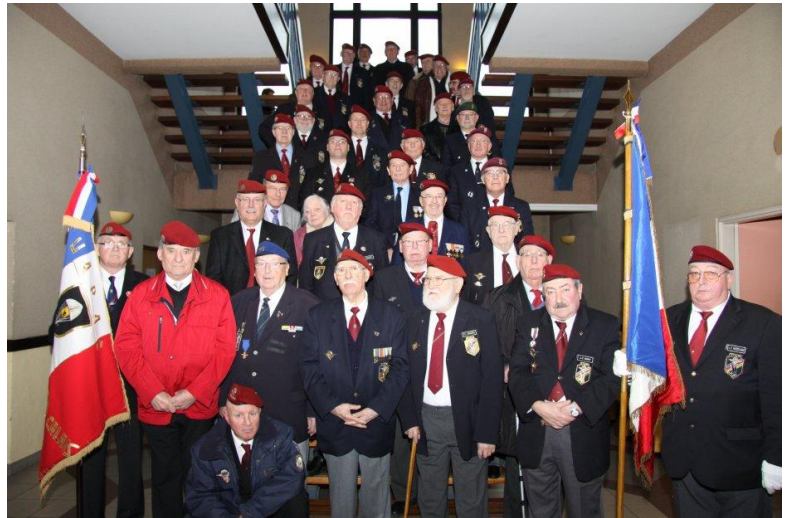
Groepsfoto; De Belgische deelnemers zijn te herkennen; zij dragen de muts op een correcte wijze.

11 van onze leden zijn ook lid van “La Section 591 UNP Rijsel”, waarom? Laten wij het een verbroedering noemen. De parachutisten of Paracommando’s zijn toch één grote familie.