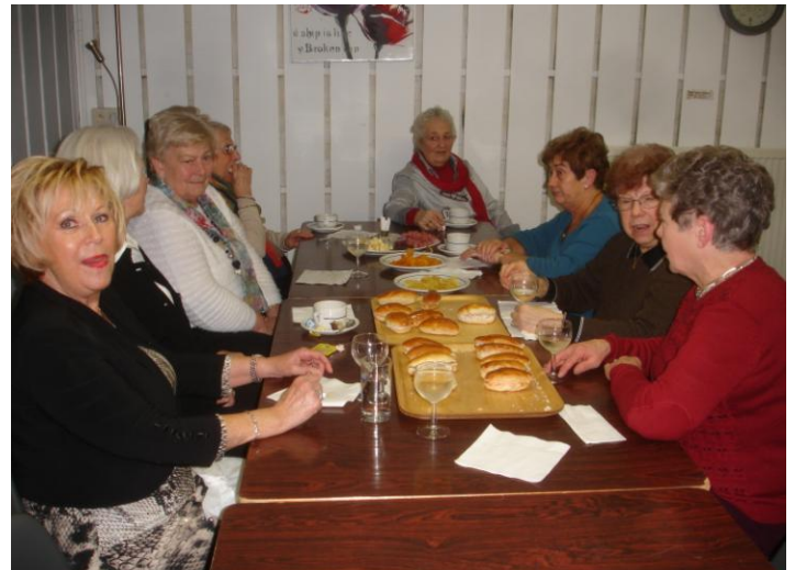
Onze vrouwtjes, zonder hun steun zouden we nergens staan