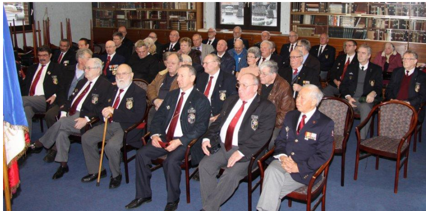
Algemeen zich op de A.G.

11 van onze leden zijn ook lid van “La Section 591 UNP Rijsel”, waarom? Laten wij het een verbroedering noemen. De parachutisten of Paracommando’s zijn toch één grote familie.