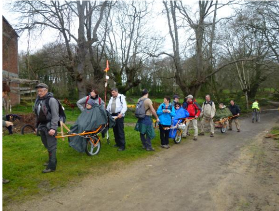
Op weg naar St.Jacobus van Compostella

In 2013, gaat hij op bedevaart naar Sint Jacobus van Compostella Spanje (de laatste 108 Km) met zijn geniaal idee, een tweewieler met daarop een zetel. In de zetel zit een gehandicapte persoon, achteraan duwt een blinde en het geheel wordt geleid en getrokken door een valide persoon.