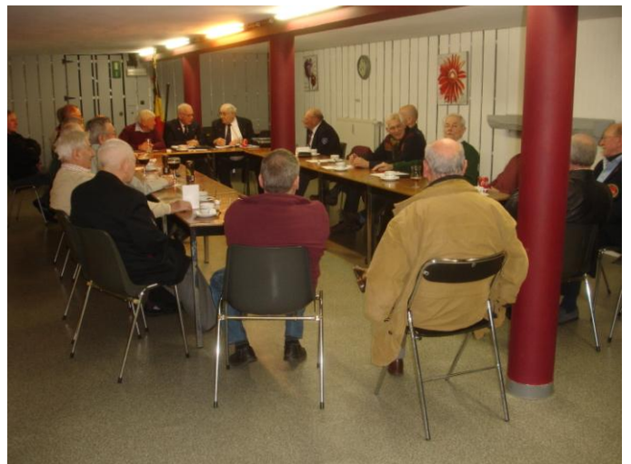
De deelnemers aan de A.V.