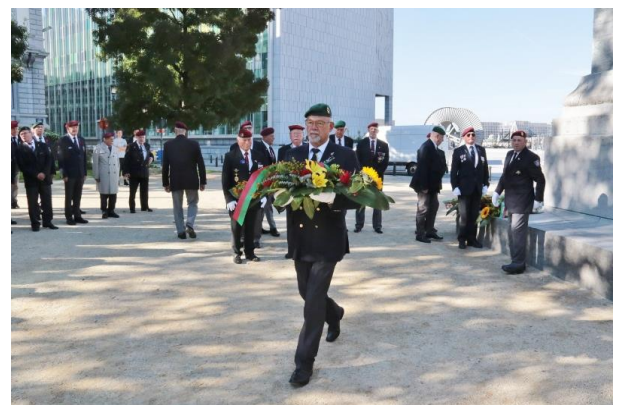
Onze voorzitter in actie