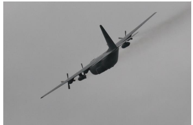
Fly Away door de 15 de Wing