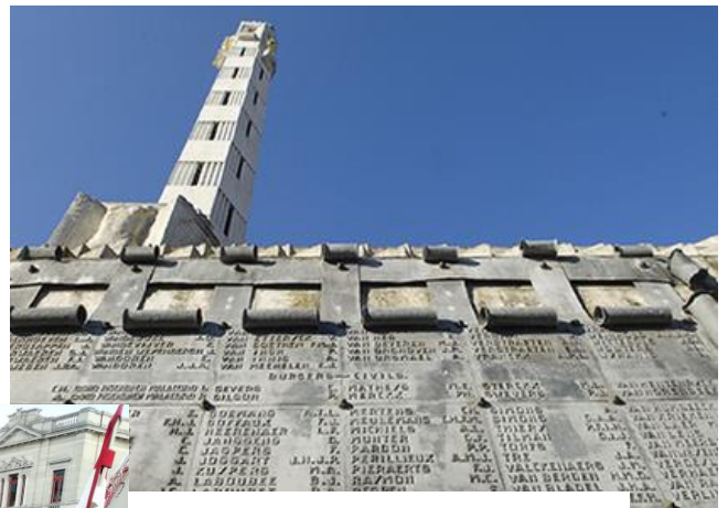
Monument waar alle namen van de burgers die geëxecuteerd werden door de Duitsers