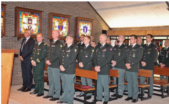
De burgemeester van Diest, de Provincie Commandant en vertegenwoordigers van verschillende PC eenheden

Om 11.00 uur had een eredienst plaats n de Memorial Kapel op het TrgCe Para te Schaffen