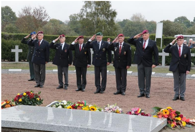
De regionalen Leuven, Antwerpen en Brabant