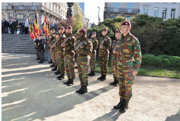
Het detachement van het 3 de Bn Parachutisten