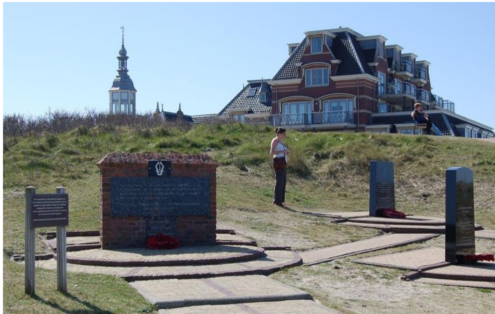
Monument van de Belgische, Noorse en Britse Commando's

Het monument werd in 1982 opgericht op initiatief van en met de financiële middelen van het "Koninklijk Verbond der Belgische Oorlogskruisen, afdeling Antwerpen" dat daarbij gesteund werd door de welwillende medewerking van het College van Burgemeester en Wethouders van Domburg.