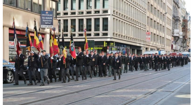
In de Koningstraat. Prachtig. Deed een beetje denken aan 1964 naar dan met meer toeschouwers.