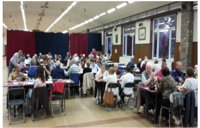
Algemeen zicht van de talrijke deelnemers