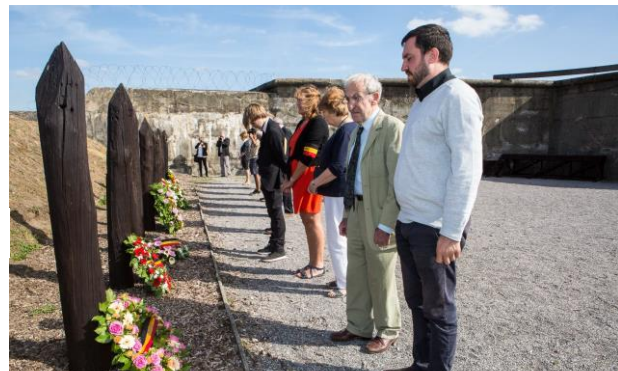
Familieleden bij de executiepalen

Niet voor niets verwierf het fort van Breendonk de bijnaam “kamp van de sluipende dood”. Met de Jaarlijkse Bedevaart ter nagedachtenis aan de oudgevangenen en de slachtoffers van