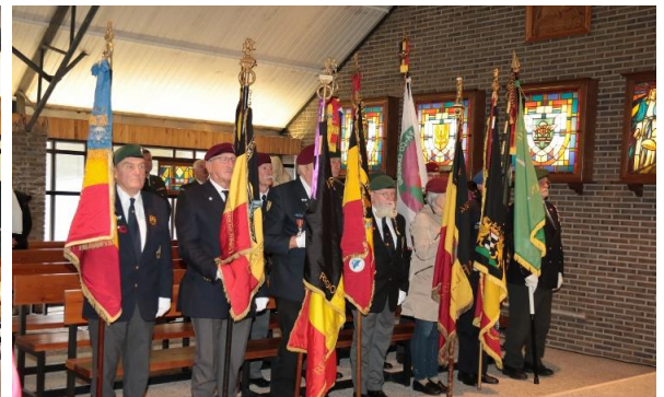
Vaandels van de regionalen