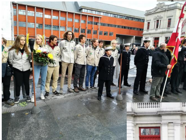
De jeugd waas vertegenwoordigd door de scouts en de Marine Kadetten