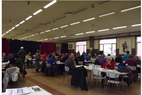
Een algemeen zicht op de deelnemers

Door de weersomstandigheden bleven de stappers ook langer in beide lokalen zitten. Alles was op. Soep, Spek en eieren, 30 taarten, broodjes waren op, met andere woorden, eten en drinken was een succes.