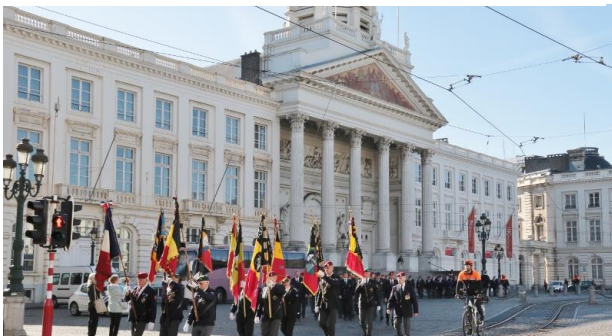
Vertrek van onze vaandels