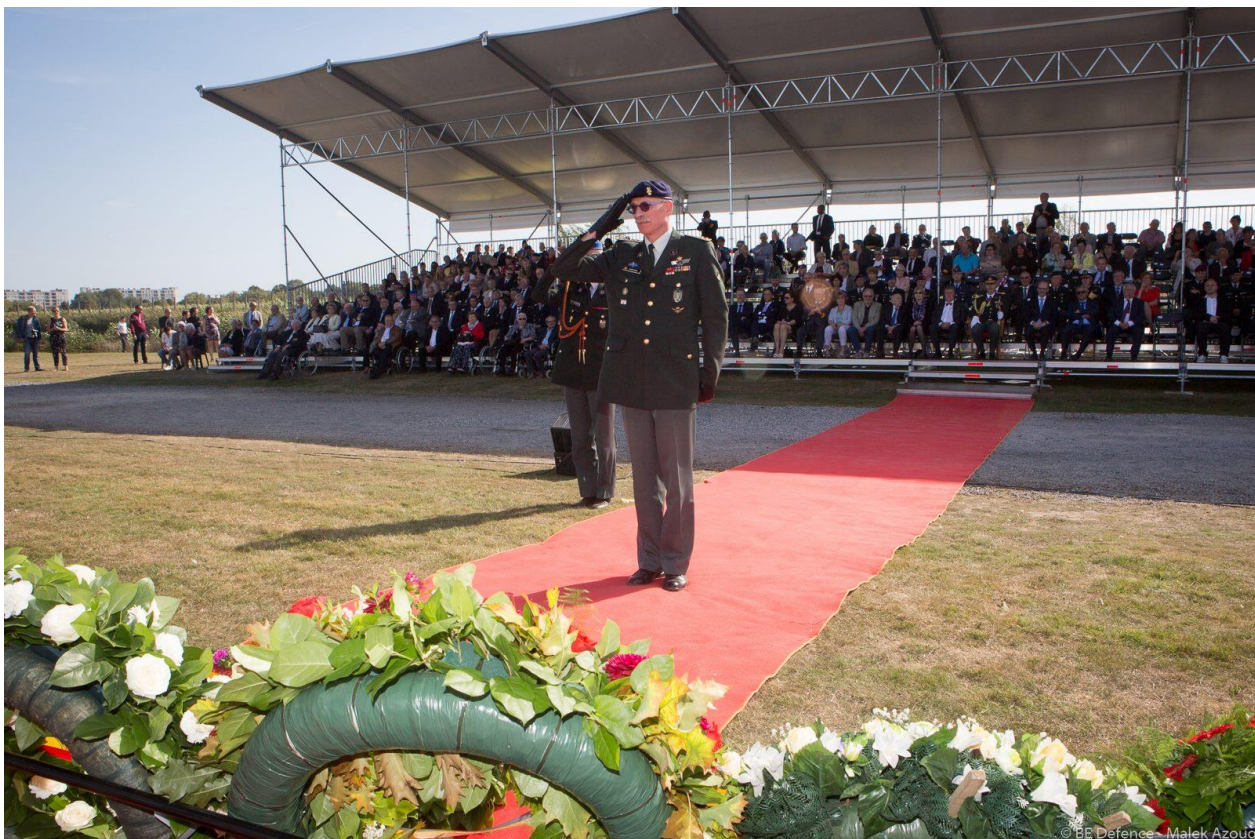
Generaal Compernel CHOD