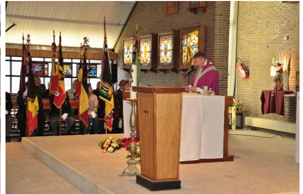
Opper Aalmoezenier droeg de eredienst op