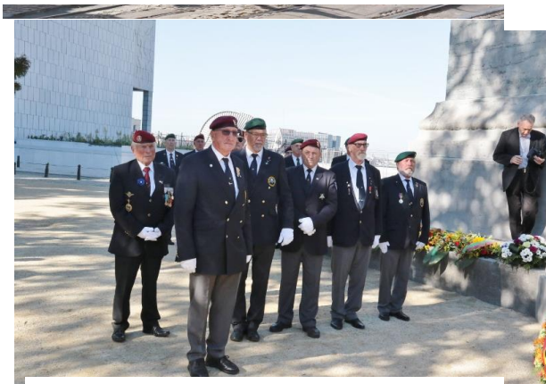
Regionale Leuven staat klaar