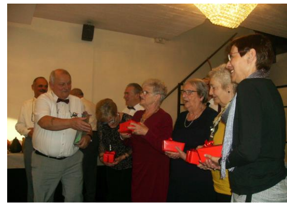
Onze (zang) koren???????