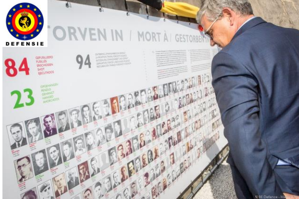
Minister Steven VANDEPUT bij foto's van slachtoffers

Breendonk, wordt de herinnering aan deze duistere en uitzonderlijke geschiedenis levend gehouden. Dit jaar werd er eveneens een gedenkplaat onthuld met daarop de namen van de slachtoffers die hier de dood vonden.