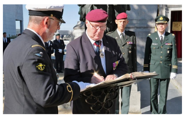
Ondertekening van het 'Gulden Boek'