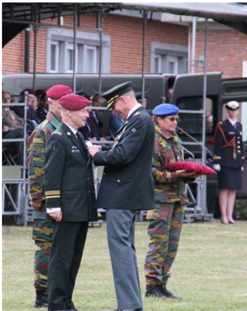
Onze nationale Voorzitter wordt geëerd