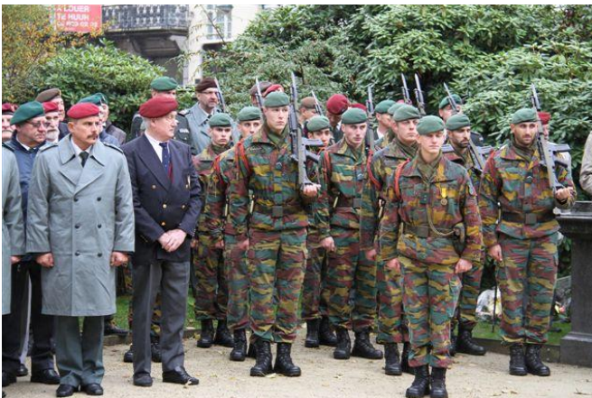
Een detachement van het 2 de Bn Commando