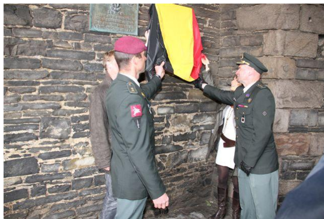
06 Oct. Gent inhuldiging van de gedenkplaat Kol Blondeel door LtKol SBH Bilo CO SFG