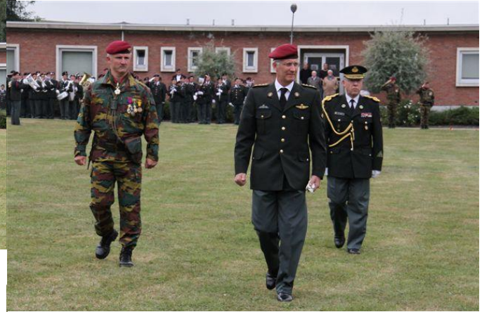
Aankomst van KH Prins Filip