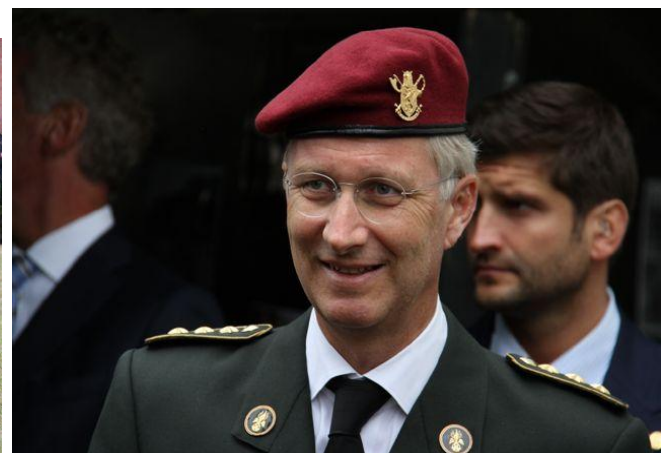
Zonder veel protocole voelde een stralende en ontspannen Prins Filip zich thuis