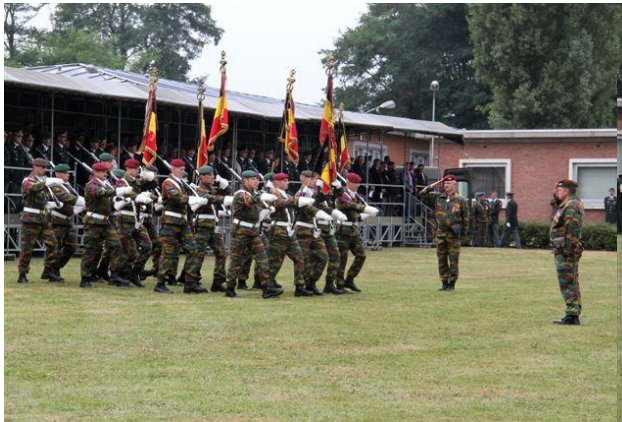
De verschillende Standaarden van de Light Brigade