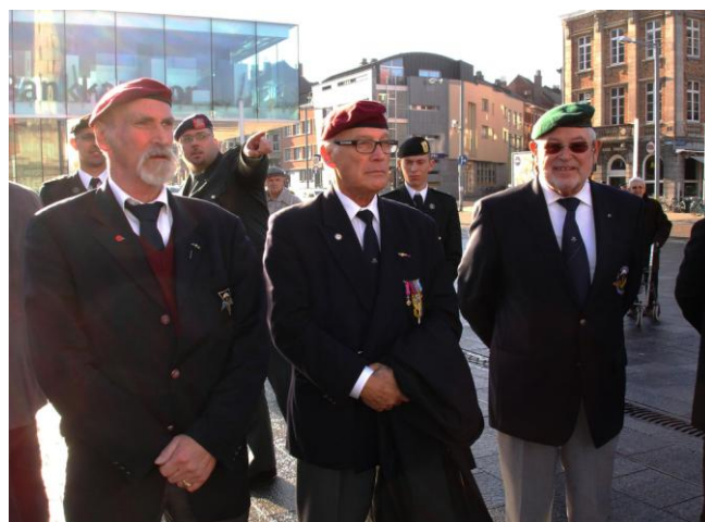
11 Nov. Herdenking einde WO I te Leuven