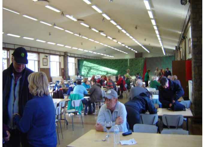
Kijk op de deelnemers 876 in totaal