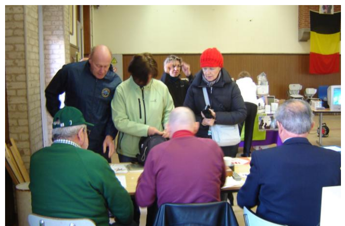
Inschrijvingen komen binnen