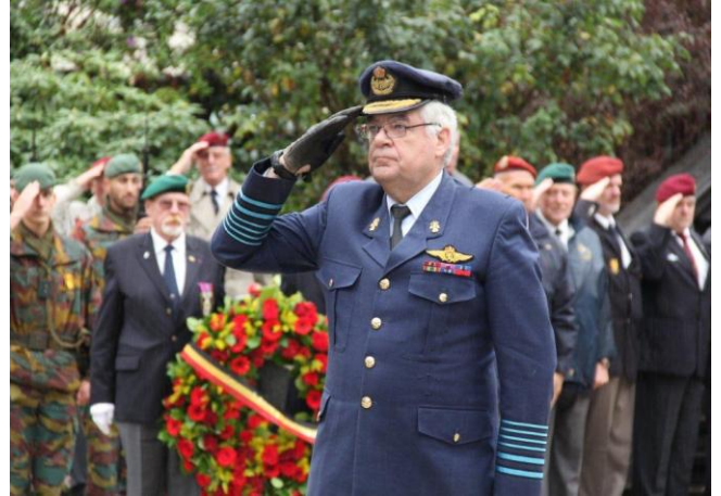
Bloemenhulde door de CHOD