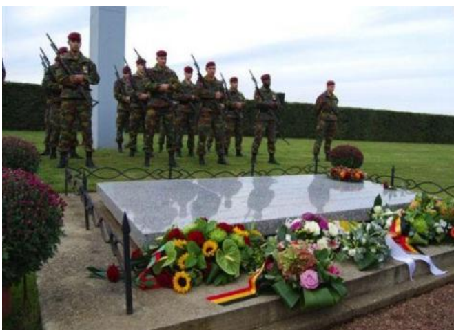
9 Nov. Herdenking Detmold te TrgC Para