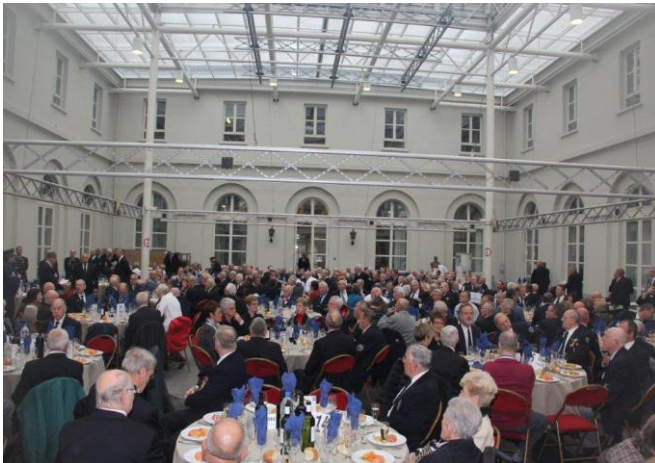
Algemeen zicht op de oude stallingen

Vervolgens ging het langs de Koningstraat, het Koningsplein naar de “Zaal der Academiën”