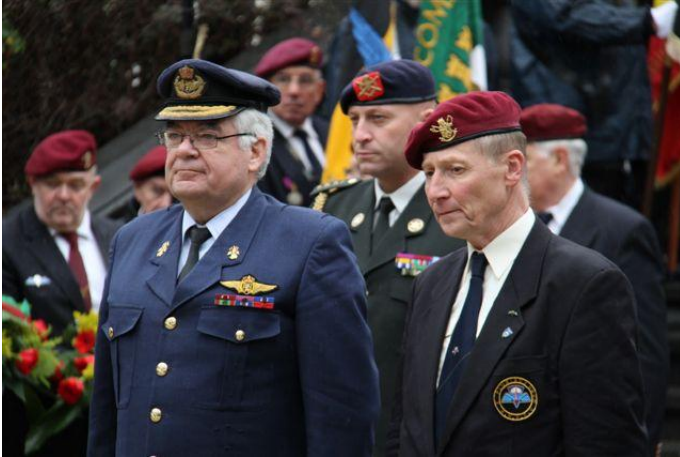
Onze nationale Voorzitter verwelkomt de CHOD