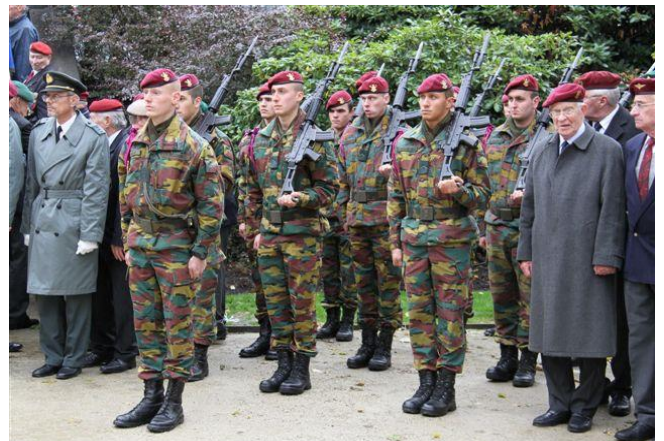
Een detachement van het 3 de Bn Parachutisten