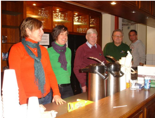
Onze ploeg in het controlepunt te Vaalbeek

Om 07.18 kwamen al de eerste stappers toe. Door de slechte weeromstandigheden, koud, nat en een stevige wind, was de start niet hoopgevend en vreesden wij niet aan de 500 stappers te komen.