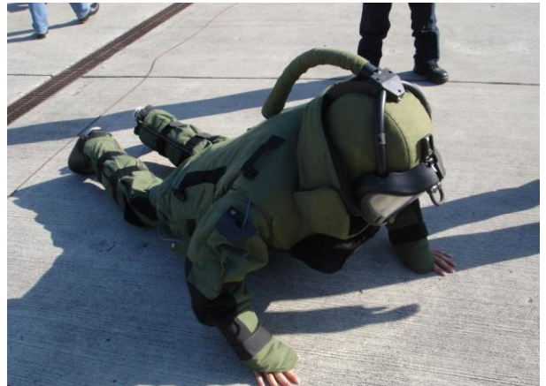
Een vrijwilliger mocht de uitrusting eens testen en trachten op te staan.....na enige tijd is het hem gelukt

Na ettelijke jaren van rust werd er terug op het terrein van DOVO te Meerdaal een Open Door gehouden. Het was een mooi programma met demonstraties en tentoonstellingen. Een bezoek aan hun museum was meer dan de moeite waard. De hongerige werden gespijsd en de dorstige gelaafd.