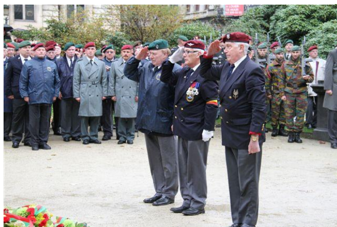
De regionalen Antwerpen, Leuven en Brabant initiatiefnemers van deze viering

De plechtigheid aan de Onbekende Soldaat verliep in alle sereniteit en dank zij de militaire steun van de Militaire Regio Brussel Hoofdstad (geluid en protocol), de Light Brigade (twee detachementen van het 2 de Bn Commando en het 3 de Bn Parachutisten) en de vertegenwoordigers van de verschillende eenheden en Training Centras werd dit een indrukwekkende gebeurtenis. Ook de oud bevelhebbers van het Regiment en alle ancients gaven aan deze plechtigheid de aandacht die ze verdiende.