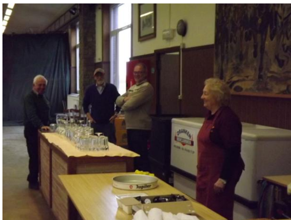
Bar en keuken staan klaar