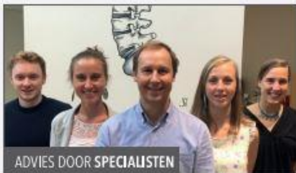
ADVIES DOOR SPECIALISTEN