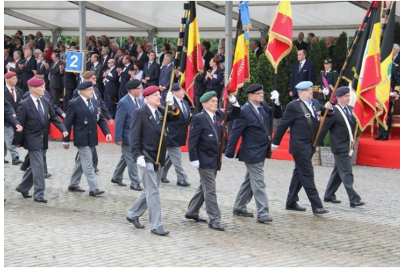
De vijf vaandels gevolgd door de Voorzitters