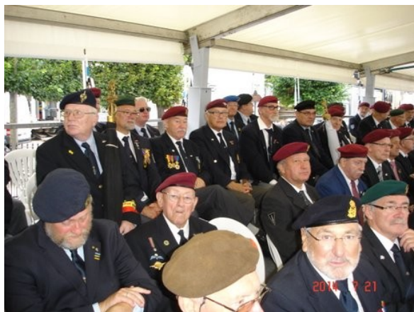
Na de défile