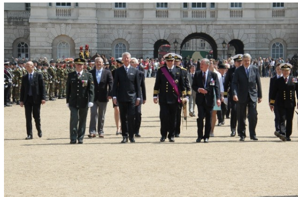
Naar het monument van de Royal Guards

Na de ceremonie aan de Cenotaaf werd nog een ceremonie aan het monument ter ere van de gesneuvelde Royal Guards gehouden. Het middagmaal namen we in de kazerne van de Royal Guards voorafgegaan door een receptie aangeboden door de Belgische autoriteiten. Daarna de terugweg.