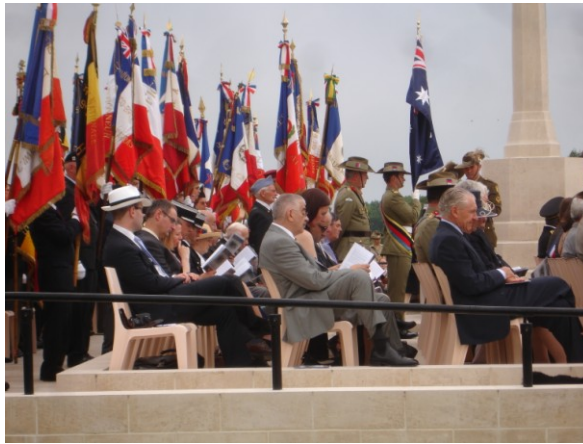
Tribune met de VIP's

juli, de 5 de Australische divisie samen met de 61 ste Britse Divisie een aanval ondernamen op de met bunkers versterkte Duitse linies. Eind 1920 waren alle Australische ongeïdentificeerde slachtoffers van de slag bij Fromelles, die men kon vinden begraven: 410 van het VC Corner Cemetery en andere begraafplaatsen.