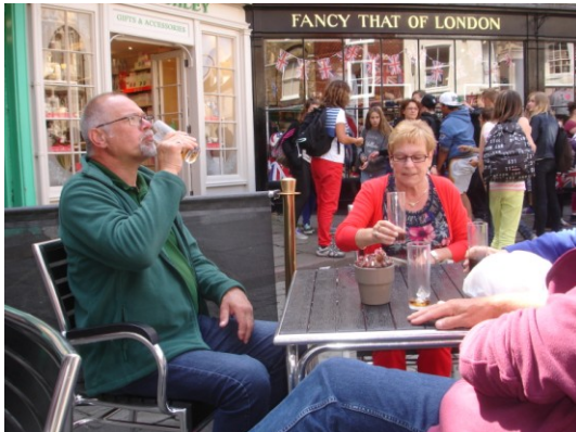
Alles doorspoele met een pint

Is dat tegengevallen, veel deeg en weinig vis, erwtenpuree, frietjes en ketchup.