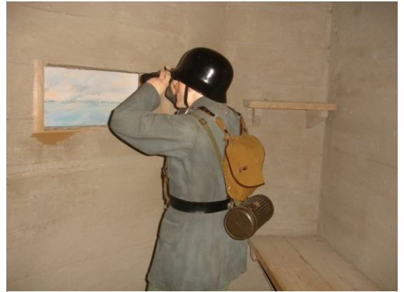
Het zal zijn beste dag niet worden

In augustus 1943, werd Southsea kust uitgeroepen tot een zone met beperkte toegang. De lente van 1944 was Zuid-Engeland hard op weg een enorm gewapend kamp te worden, van mannen en voertuigen. Portsmouth was het hoofdkwartier en het belangrijkste vertrekpunt voor de militaire en marine eenheden die bestemd zijn voor Sword Beach op de Normandische kust. Portsmouth heeft ten noorden en ten oosten een natuurlijke bosrijke omgeving, ideaal voor troepen te herbergen en verbergen.