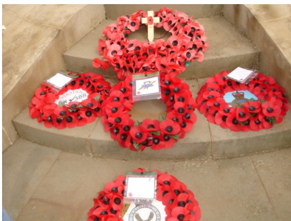
In het centrum, ons kranje

Op 9 juli 1993 kwam Koningin Elizabeth de Memorial inhuldigen. Page zijn droom werd dus werkelijkheid. Hij stierf in augustus 2000, kort na zijn bezoek aan de Memorial voor de 60 ste verjaardag van de slag om Engeland. We maakten van ons bezoek gebruik om een kleine bloemenkrans neer te leggen aan beide gedenksteden.