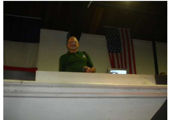
Onze Commando Roger heeft eindelijk zijn boot gevonden, nu nog water

Documenten en diarama's zijn een streling voor het oog. Werkelijk de moeite om te bezoeken.