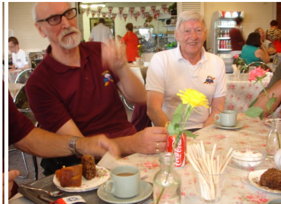
Als het voor een goed doel is mag men zondigen