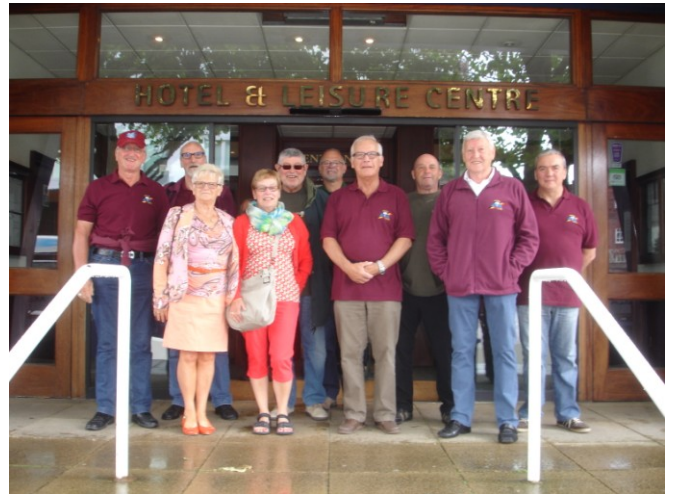
Voor de ingang van ons hotel

Het zal een pizzaria worden. Iedereen lust geen pizza, dus was het normaal dat enkelen een ander etablissement opzochten.