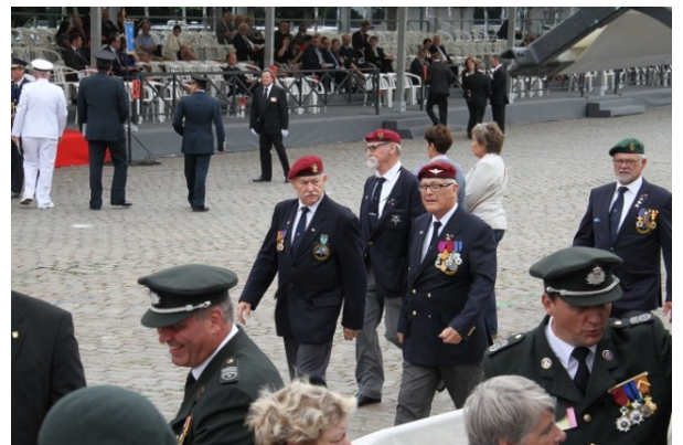
Op weg naar ons RV

150 kaarten voor de 5 verenigingen die deel uitmaken van het Veteranen Instituut. 30 voor de BSD (Belgische Strijdkrachten Duitsland), 30 Technische Bijstand, 30 UNO, 30 Omegang en 30 voor onze ANPCV. Als u ons detachement door de jaren heen ziet, zijn wij altijd met +/- 100. Het is dan ieder jaar bedelen bij de andere vereniging