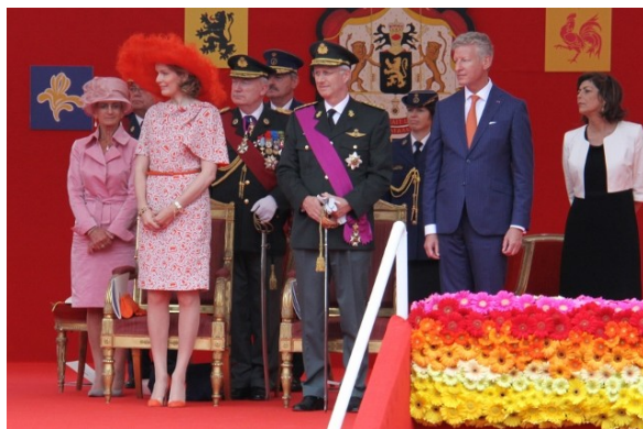
Koningin Mathilde - Koning Filip