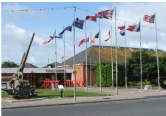
Ingang van het museum

Ontbijt tot 09.30 uur. Vervolgens bezoek aan het museum D Day.