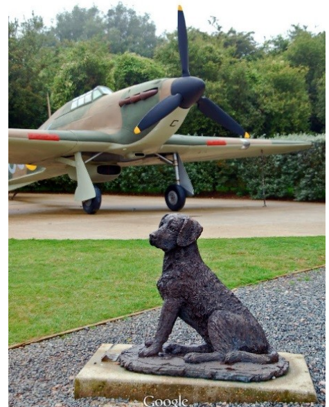
Wacht op zijn baasje

11.30 op naar onze 3 de stop. De innerlijk mens verzorgen