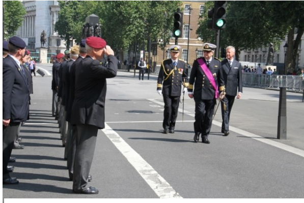
Prins Laurents schouwt ons detachement