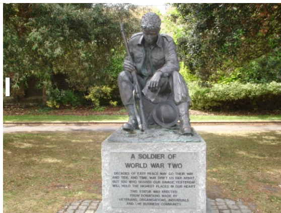
Een soldaat uit WO II

woorden - "OK, let's go." Op de ochtend van 6 juni werden de mensen van Portsmouth wakker en tot hun verrassing was de grote armada van schepen verdwenen. De straten tot dusver verslikt van militair verkeer waren verlaten.