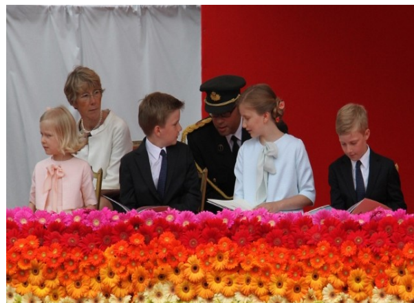
Zijn er misschien twee toekomstige Para's bij