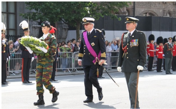
Prins Laurent bij de bloemenhulde

Ter gelegenheid van de 80ste verjaardag woonde Prins Laurent en ontslagnemend minister van de Defensie Pieter De Crem de ceremonie aan de Cenotaaf bij. Ze legden bloemenkransen neer aan de Cenotaaf.