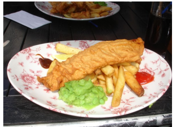
De fameuze Fish and Chips